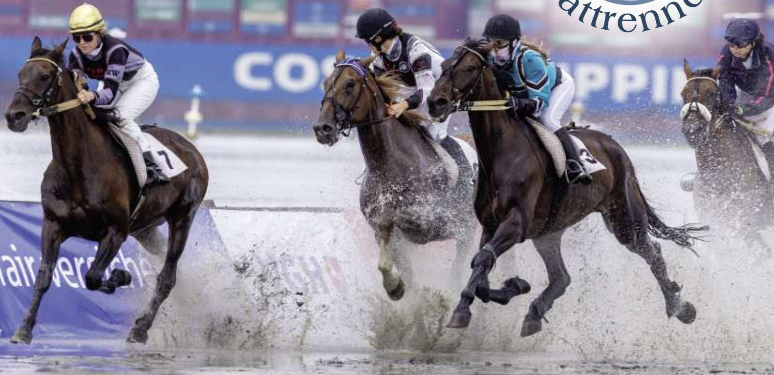
Trabreiten im Duhner Watt 2022