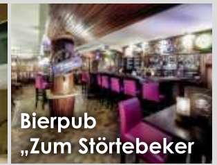
Bierpub „Zum Störtebeker“