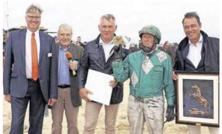
2. Rennen – Preis des Nordseeheilbades Cuxhaven (ausgestattet durch Stadt Cuxhaven und EWE AG) und Wanderpokal der PNE AG – Pure New Energy AG