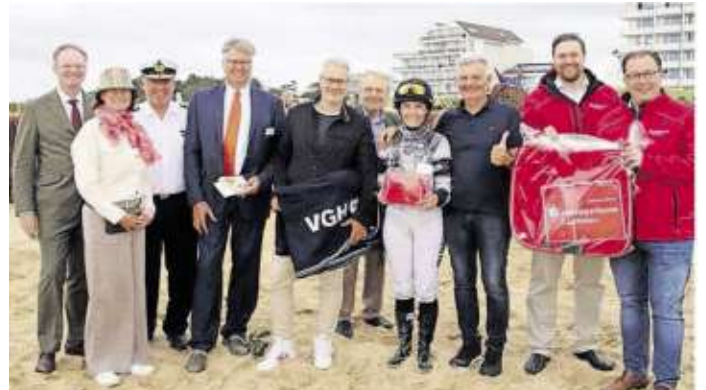
6. Rennen – Preis der Stadtparkasse Cuxhaven und der VGH: (Klaus-Kamp-Gedächtnisrennen/Preis von Duhnen)