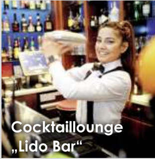
Cocktailounge „Lido Bar“