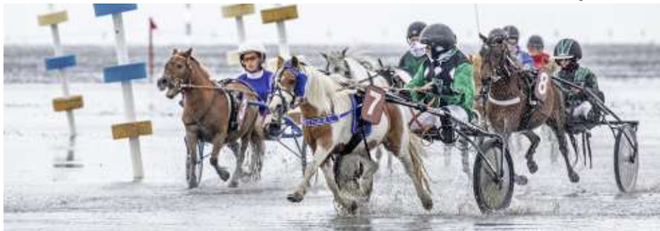
Das außergewöhnliche Geläuf auf dem nassen Duhner Wattboden ist auch für die jungen Minitraber eine besondere Erfahrung.