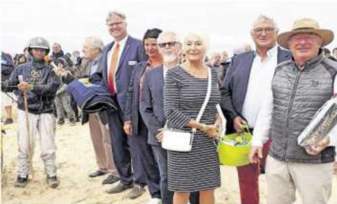
3. Rennen – Preis der MIBAU-Baustoffhandel Cadenberge und Reederei Hartmann: (Franz-Mützelfeldt-Gedächtnisrennen/Preis Gemeinde Wurster Nordseeküste)