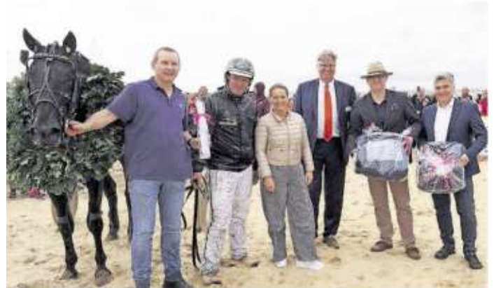
4. Rennen – Preis der Rhenus Cuxport GmbH und der Bäckerei und Konditorei Itjen e.K. (Preis von Grimershörn)