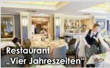
Restaurant „Vier Jahreszeiten“