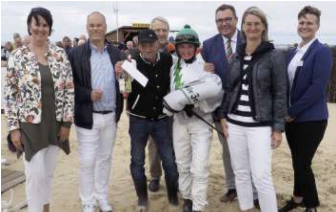
1. Rennen – Preis der Cuxhaven-Niederelbe Verlagsgesellschaft und des Havenhostels Cuxhaven: (Preis von Land Hadeln - Amazonenrennen)