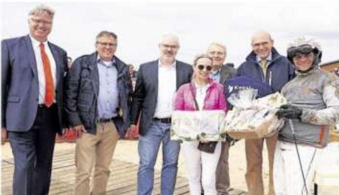
5. Rennen – Preis der Kaesler Nutrition GmbH der Bäckerei und Konditorei Itjen e.K. (Hans-Heinrich-Isenbart-Gedächtnisrennen/Preis von Sahlenburg)