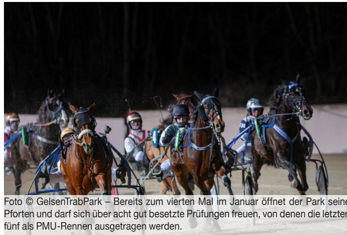
Bereits zum vierten Mal im Januar öffnet der Park seine Pforten und darf sich über acht gut besetzte Prüfungen freuen, von denen die letzten fünf als PMU-Rennen ausgetragen werden.

Preis von Nantes: Frecciarossa Font sprang sich in aussichtsreicher Lage um ein besseres Geld. Bleibt die Stute auf den Beinen, favorisieren wir sie leicht vor Malaky Fafa, der sich hier im Park auf dem Ehrenplatz stark präsentierte. Olivander Mac zeigte sich bei seinem letzten Ehrenplatz in guter Verfassung und ist definitiv ein Kandidat für die Dreierwette. Auch Pippi Europort, Nick H, der verbesserte Mees Cavallo und Omani sind interessante Mitstreiter. Grace Park hatte in der Außenspur zuletzt keinen einfachen Stand, leichter wird es hier jedoch ebenfalls nicht. Hactiva und Juillet Dream CJ bieten aktuell einfach zu wenig, um in die Entscheidung einzugreifen.