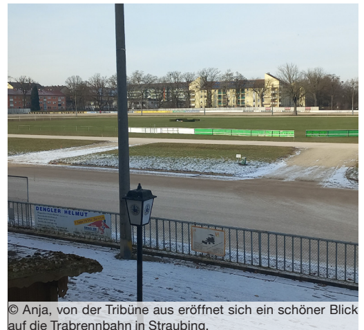
von der Tribüne aus eröffnet sich ein schöner Blick auf die Trabrennbahn in Straubing.